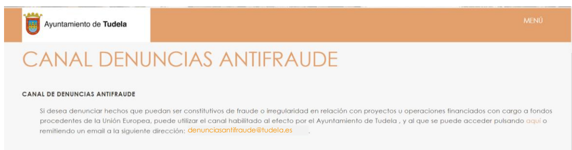
Ilustración 1. Modelo de referencia basado en el canal de denuncias actualmente activo en el marco del POPE 2014-2020.

Además de los procedimientos internos para detectar un caso de fraude, es indispensable contar con una herramienta que permita a cualquier persona, tanto de dentro de la corporación como externa a la misma, denunciar cualquier sospecha, que permita a la comisión abrir una investigación. En definitiva, es una herramienta digital, que permite comunicar, de manera confidencial y con un sencillo formulario, las actividades y conductas supuestamente irregulares. Este canal, está disponible en la web municipal y será responsabilidad de la comisión hacer el seguimiento oportuno de las denuncias que se tramiten por el mismo. Cualquier comunicación, será registrada, iniciándose una verificación previa la investigación oportuna, a efectos de determinar el tratamiento que deba darse a la misma.